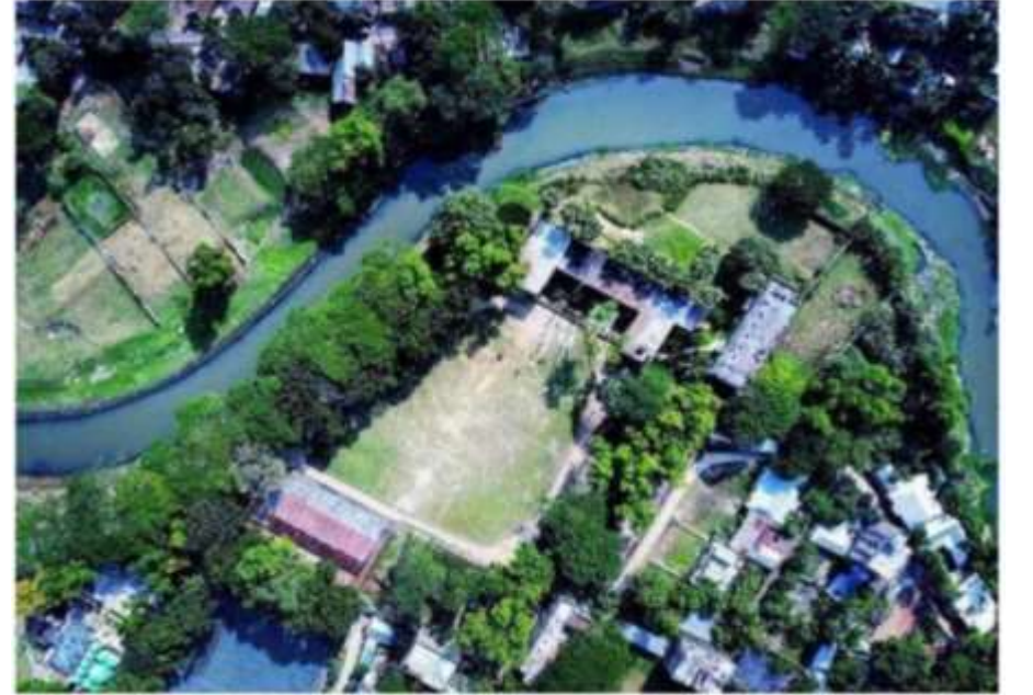
পাখির চোখে নওয়াব ফয়জুল্লাহ সরকারি কলেজ

বিজ্ঞপ্তির দ্বারা ছাত্র-ছাত্রীদের মাধ্যমে সভার নির্ধারিত তারিখ সংশ্লিষ্ট অভিভাবকদের জানানো হবে।